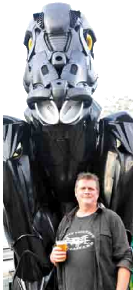
Strapper, della Mutoid Waste Company, accanto a una sua opera nel campo di Mutonia a Santarcangelo

«La nostra arte voleva andare contro un muro di pigrizia. Andavamo in mezzo alla gente con i nostri mezzi, le nostre opere. E questo ce lo ha insegnato il punk»